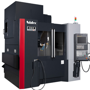
立形マシニングセンタ VM53RII